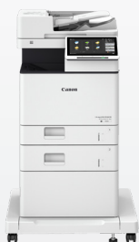
iR ADV DX 717/617/527